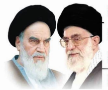
مجله گرامی باسلام و احترام

طی بدین و چهارمین سالگرد پیروزی کلوپنند انقلاب اسلامی، یادآور تلاش مردمانی است که از دیرباز پیش از آن برای بدست آوردن عزت، آزادی، استقلال و هویت اسلامی و ایرانی خود مبارزه نمودند. تلاشی که با برتری حضرت امام خمینی (ره) بزرگترین رضای جمعی قرن را تشکیل داد. رضای که در واقع تجدید شایسته دوباره باین گفتمان و عقیده انقلاب اسلامی و زنده نگه داشتن یاد و خاطره شهیدان این انقلاب است. در محفل سدهای گذشت این کشور همواره مورد تهاجم و بیگانه گان خارجی و موجد بیان داخلی بوده است و شکل گیری نظامی متدبر که تواند از تهاجم ارضی آن دفاع نمود عزت و بزرگی را به آن بازگرداند، یکی از آرزوهای مردم بود و این آرزو با شکل گیری نهضت انقلاب اسلامی به وقوع پیوست. خداوند بزرگ صنعت برق امروز نیز مانند نخستین روزهای این انقلاب کلوپنند جهت خدمت رسانی در مسیر توسعه اقتصادی کشور خود را مستعد دانست و با کارنامه ای در شتاب از سر تحریم های ظالمانه عبور نموده است. اینجانب فراخسین بوم الا در مبارک فخر و سالگرد پیروزی انقلاب اسلامی را با کمال کمال شرکت بهره برداری نیروگاه طرشت (نیروگاه طرشت و نیروگاه گل تریگی شیروان) تبریک عرض نموده از خداوند منان توفیق روزافزون برایتان خواستارم.